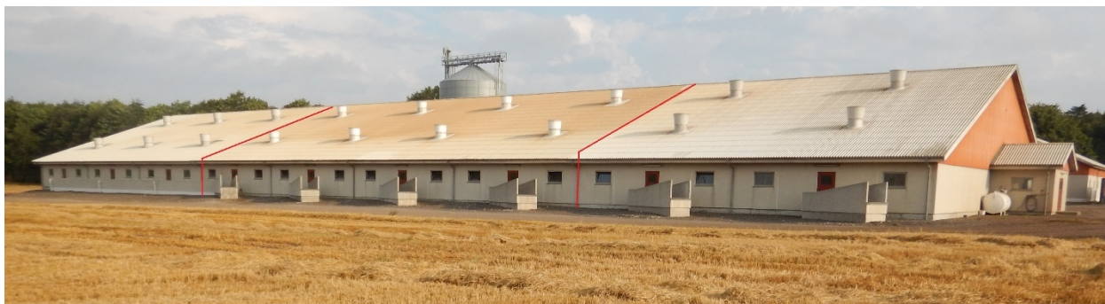
Figur 6: Den samlede staldbygning set fra syd. Afsnittet "Stald 1998" befinder sig mellem de to røde linjer.

staldbygning, som er opført af betonsandwichelementer med fritlagte sten og eternit-tagbeklædning, og at staldafsnittet er velholdt.”