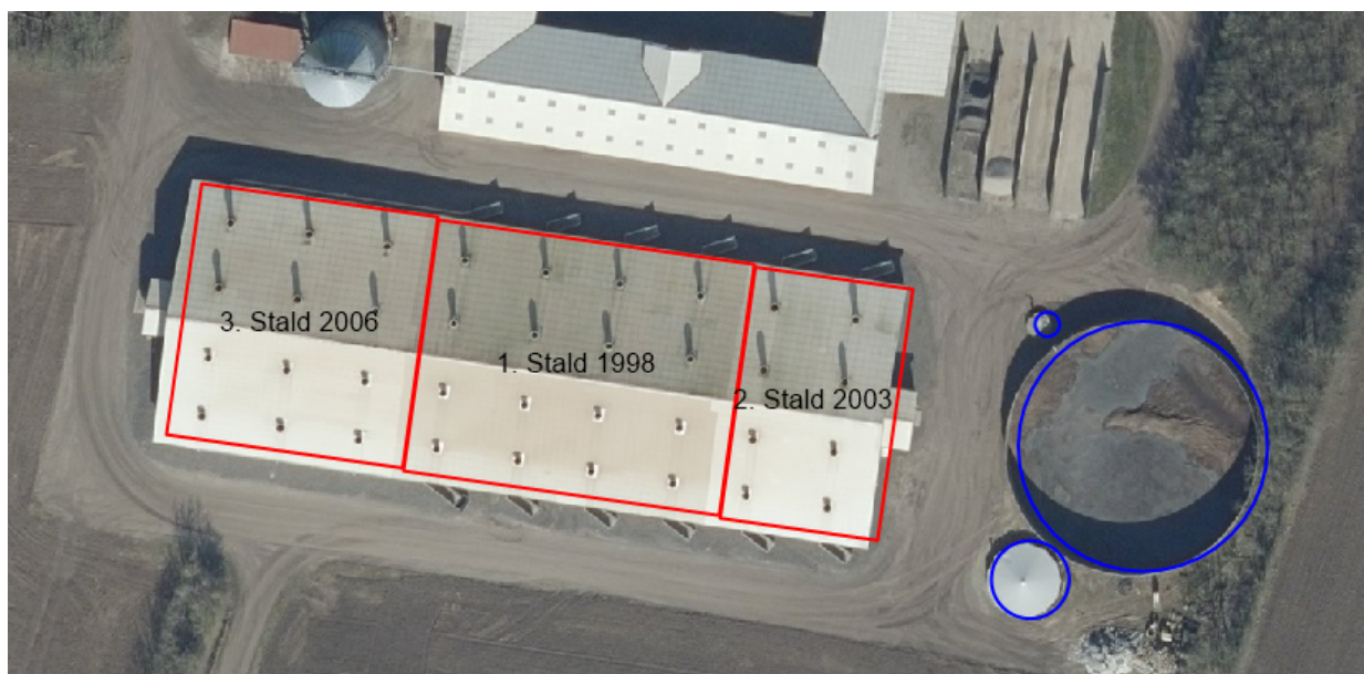
Figur 5: De 3 staldafsnit.

Det er i parentes anført, hvor mange sektioner der ifølge bilaget til revurderingsskemaet er i hvert afsnit.