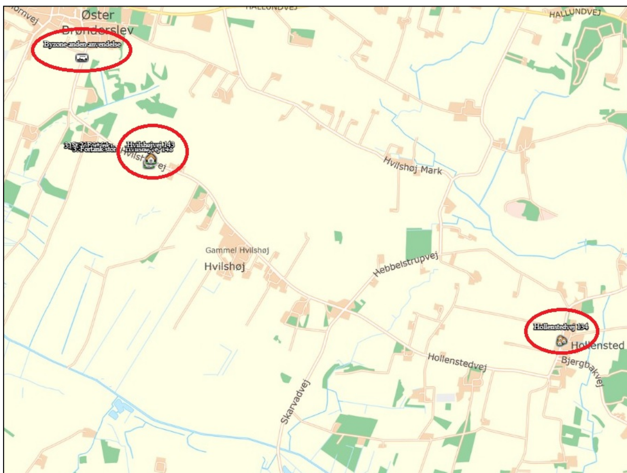
Figur 3: Nærmeste naboer i de 3 kategorier.