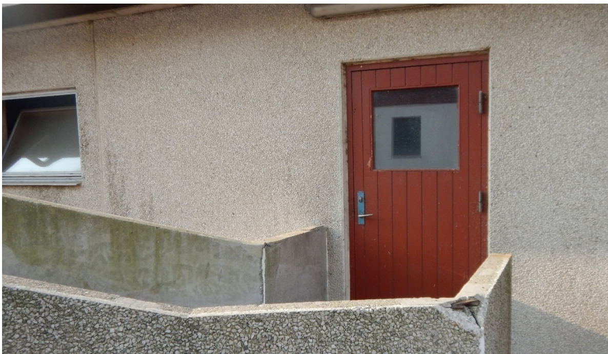
Figur 7 og 8: Staldbyggeriet er opført i betonsandwichelementer.