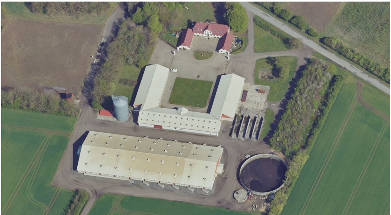
Figur 1: Skråfoto af husdyrbruget på Hvilshøjvej 98.

Miljøgodkendelsen fra 2003 samt tillæg hertil fra 2006 for husdyrbruget på Hvilshøjvej 98, Brønderslev er netop blevet revurderet af Brønderslev Kommune. Dette brev indeholder afgørelsen af revurderingen og det deraf følgende påbud.