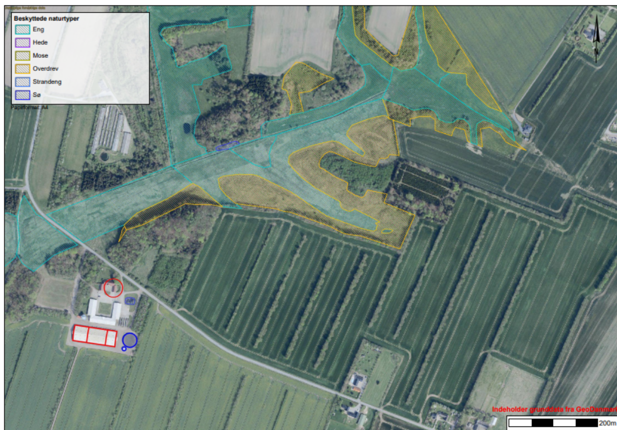
Figur 4: Beliggenhed af husdyrbruget på Hvilshøjvej 98 og nærmeste §3 beskyttede natur. Kategori 2-natur er det sammenhængende overdrev nordøst for husdyrbruget.

Cirka 4-500 m nordøst for husdyrbruget ligger et overdrev, se figur 4.